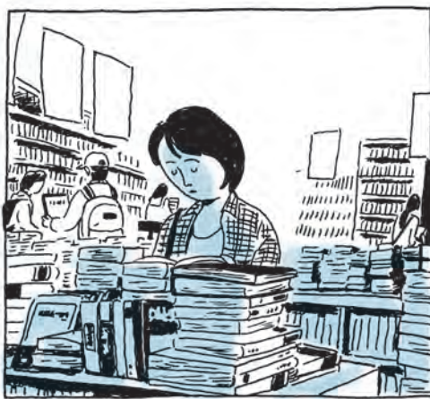
Enseigne : Hanyang Toonk, le monde joyeux du manhwa [bande dessinée coréenne (Ndt)].