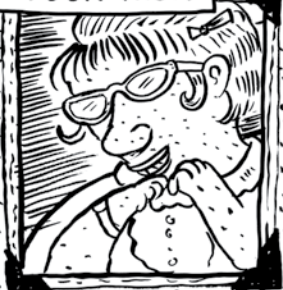
MOI

ALORS. PRÉNOMS : MAYBONNE MAYDELLE! UN NOM QUE JE DÉTESTE! MA PETITE SŒUR A ÉCOPIÉ DE MARLYS MARCELLE. NOTRE MÈRE VOULAIT QUE CE SOIT ASSORTI, UNE TRAGÉDIE PERSONNELLE POUR MOI.